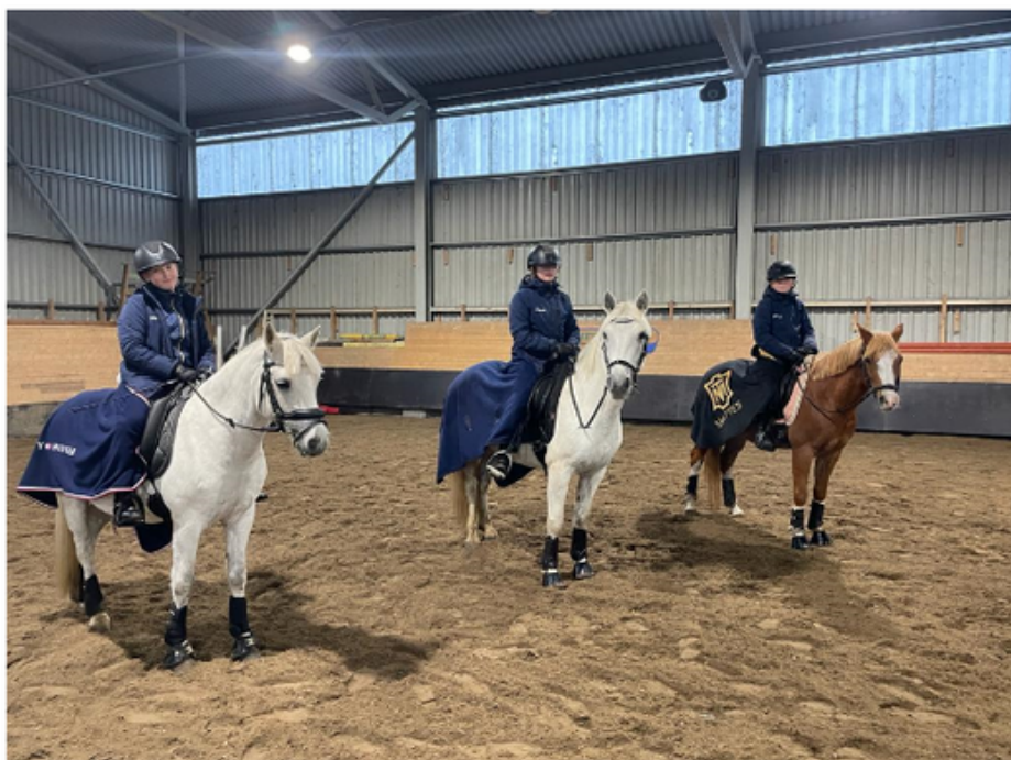
Meri-Lapin ratsastajien ponitytöt menossa valmennukseen.