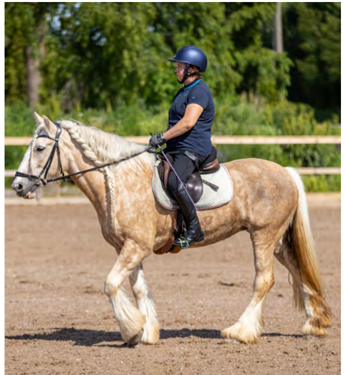
Ratsastaja voidaan tukea satulaan tarranauhojen avulla.

Halvaantumisen voi aiheuttaa sairaus, synnynnäinen tila tai loukkaantuminen. Halvaantuminen voi ilmetä kehon eri osissa, vartalossa ja raajoissa. Se voi olla esimerkiksi toispuoleista tai ilmetä alaraajoissa. Halvaantunut ratsastaja ei hahmota kehonsa halvaantunutta osaa. Tätä "unohtunutta" puolta tai kehon osaa ei kuitenkaan ratsastuksessa kannata jättää huomiotta, vaan avustaja tukee ratsastajaa käyttämään myös sitä, mikäli se on mahdollista. Jos ratsastajan alaraajat ovat hal-