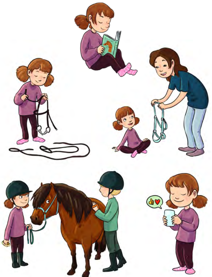
On erilaisia tapoja oppia uusia asioita.

Laaja-alaisiin oppimisen vaikeuksiin liitetään useimmiten kehitysvammaisuus. Kehitysvamma aiheuttaa vaikeuksia ymmärtämis- ja käsityskyvyn alueella. Kehitysvamman aste vaihtelee lievästä vaikeaan. Monilla kehitysvammaisilla ihmisillä on lisävammoja, jotka saattavat vaikeuttaa liikkumista, puhetta tai vuorovaikutusta muiden ihmisten kanssa. Uusien asioiden oppiminen ja käsitteellinen ajattelu ovat kehitysvammaisille ihmisille vaikeita. Kuitenkin kehitysvammaiset ihmiset oppivat monia asioita samalla tavalla kuin muut, mutta hitaampaan