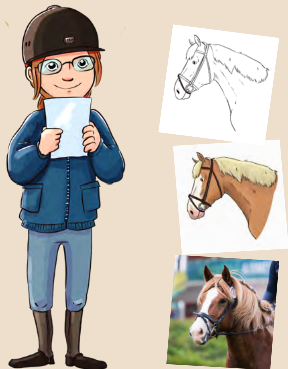
Kuvakommunikaatiossa voi käyttää erilaisia, selkeitä kuvia.

SRL:n internetsivuilta löytyy kuvakommunikointiin tarkoitettuja kuvia, joita voi käyttää tallilla, avustamisessa ja ohjaamisessa. Niitä on myös helppo piirtää tai kuvata itse, jolloin kuvat ovat juuri oikeanlaisia.