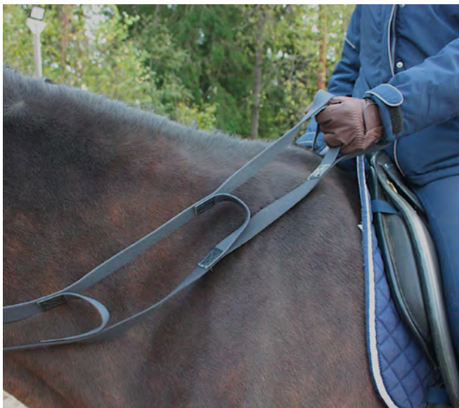
Lenkkiohjat helpottavat ohjien pitämistä kädessä ja ohjan pituuden säätelyä.

Raippaa voidaan käyttää tehostamaan tai korvaamaan pohjeapuja. Ratsastajalla voi olla raippoja käytössä yksi tai kaksi ja niiden pituus voi vaihdella tarpeen mukaisesti. Saatavilla on myös käyriä raippoja, jotka muotonsa vuoksi menevät lähemmäksi hevosen kylkiä kuin suorat raipat.