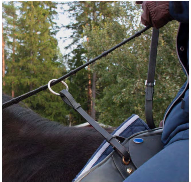
Ohjat voivat kulkea ohjaimen läpi.

Erikoisohjia löytyy hevostarvikeliikkeistä. Satulasepät sekä suutarit voivat valmistaa tilauksesta erilaisia ohjia. Sopivan ohjamallin ja -tyypin ratsastaja löytää yleensä vasta jonkin aikaa ratsastettuaan ja erilaisia ohjia kokeiltuaan.