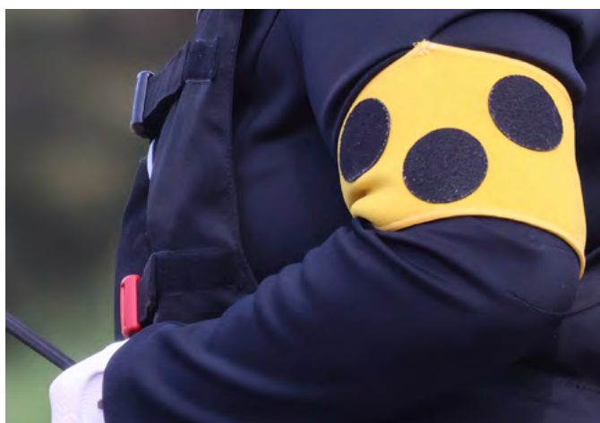
Näkövammaisen ratsastajan hihamerkki

tajan. Kilpailuissa hihamerkki on pakollinen. Ratsastuskentällä muut väistävät näkövammaista ratsastajaa.