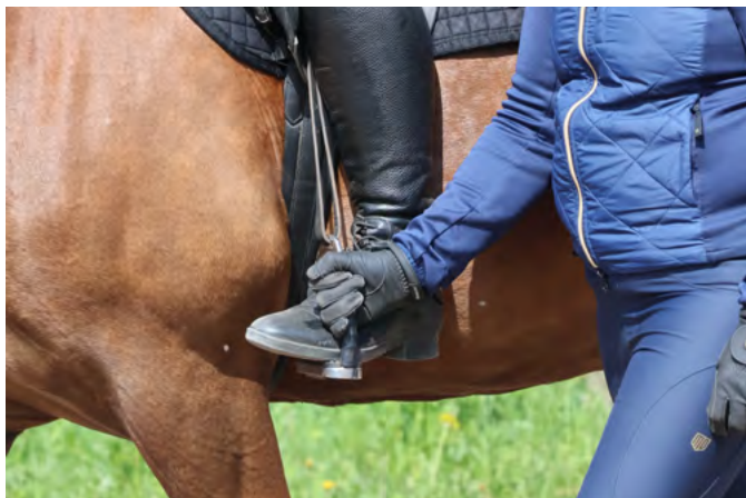
Avustaja voi pitää jalustinta oikealla paikalla. Tällöin ratsastajan jalkakin on oikeassa paikassa.