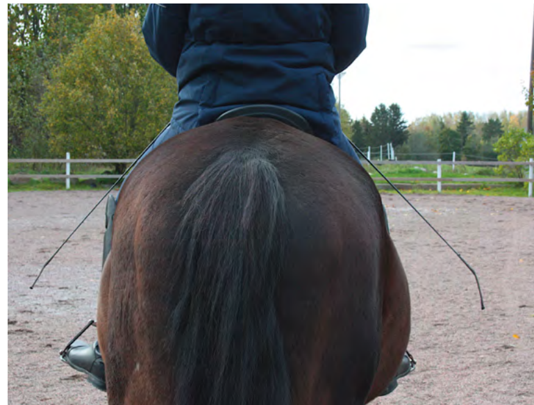
Raippoja voi olla käytössä yksi tai kaksi.