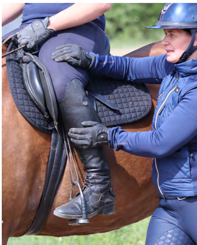
Ratsastajan jalasta voi pitää kiinni eri tavoin, mutta otteen pitää olla sellainen, että se ei aiheuta lisäongelmia.