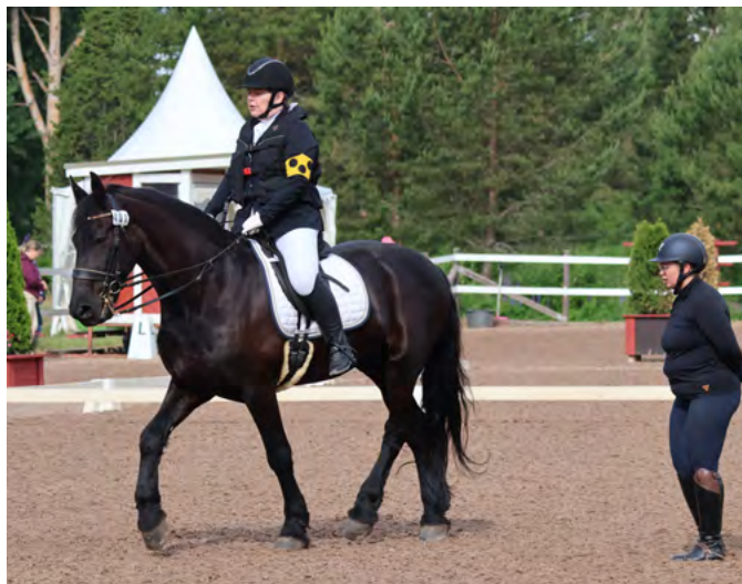
Avustaja kertoo äänellä kirjaimen kohdan ratsastuskentällä.