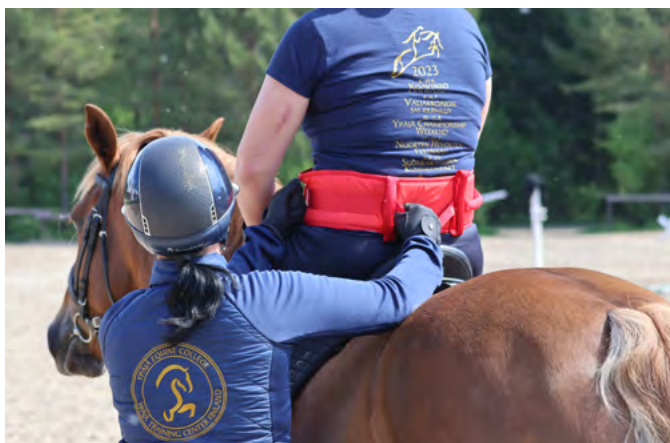
Avustaja voi auttaa ja tukea jäykkää ratsastajaa. Nostovyö auttaa ratsastajan avustamisessa.