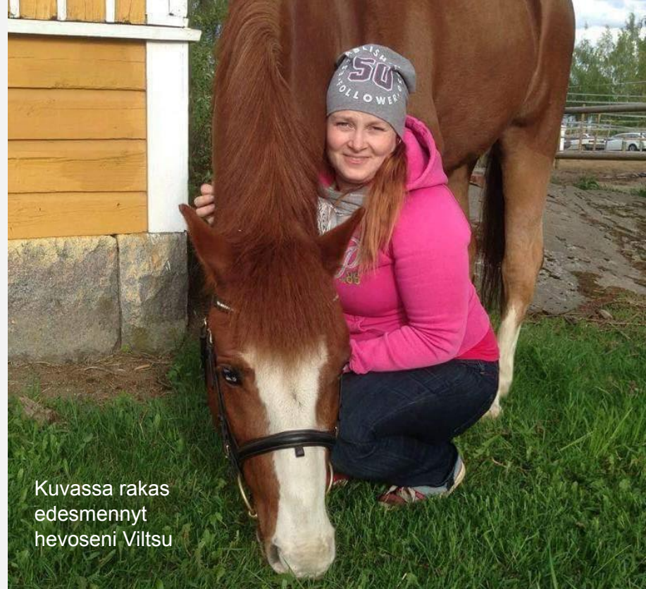
Kuvassa rakas edesmennyt hevoseni Viltsu

Minulla on halu kehittää alueen toimintaa avoimempaan suuntaan ja haluan luoda seurojen välille yhteistyötä. Miten kehitämme kilpailujen järjestämistä, joka tässä ajassa on erittäin haastavaa. Meidän pitää yhdessä löytää keinoja saada lisää aktiivisia jäseniä ja talkoolaisia mukaan toimintaan. Mikään seura ei toimi ilman tätä valitettavasti pienenevää joukkoa innokkaita lajin harrastajia unohtamatta ei-kilpailevia harrastajia.