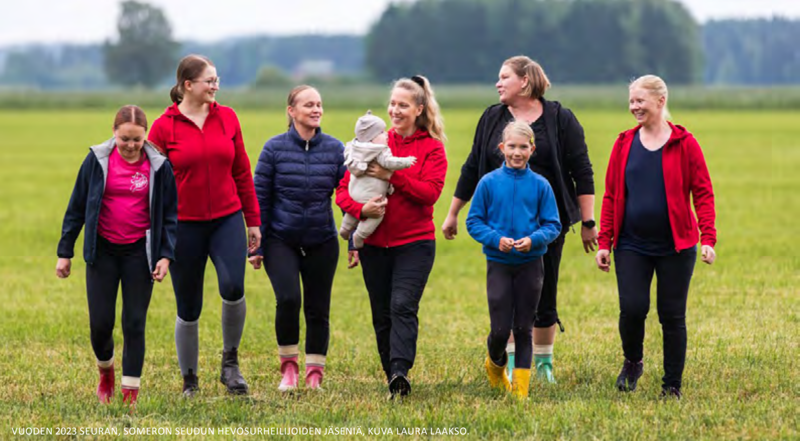
VUODEN 2023 SEURAN, SOMERON SEUDUN HEVOSURHEILIJOIDEN JÄSENIÄ, KUVA LAURA LAAKSO.

kanssa suunnittelee ja tuottaa seuratoiminnan vuosikellon sekä markkinoinnin ja viestinnän suunnitelman. Liiton nettisivustoa sekä sosiaalisen median alustoja hyödynnetään seuratoiminnan ja – palvelujen sisäisessä viestinnässä niin päivittäisviestinnässä kuin teemakuukausien ja/tai kampanjoiden muodossa. Seurojen henkilöjäsenille viestitään suoraan heille sähköpostitse lähtevällä jäsenkirjeellä ja seura-aktiiveille uutiskirjeellä. Liiton yleisistä viestinnän linjauksista on kerrottu lisää kohdassa 2.4.